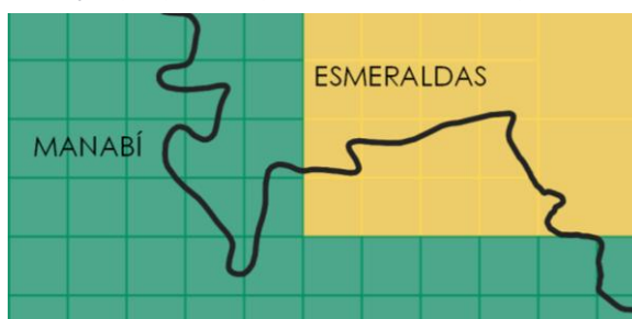
Figura 2. Límites provinciales del marco de muestreo de áreas para investigaciones agropecuarias. Un ejemplo para las provincias de Manabí y Esmeraldas