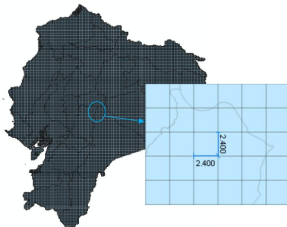
Figura 1. Generación de las Unidades Mínimas de Estratificación (UME)